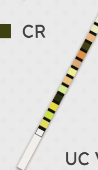
UC VET13 Plus