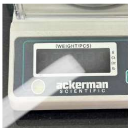
PANEL DE CONTROL LCD