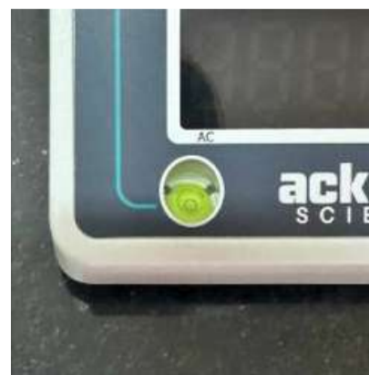
NIVELADOR TIPO BURBUJA