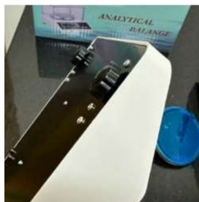
BASE REGULABLE ANTIDESLIZANTE