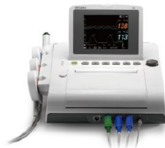
F3 Monitor fetal