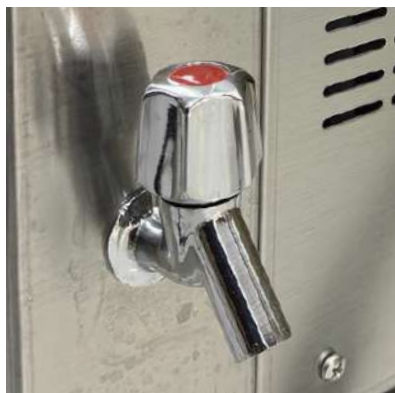
GRIFO DE DESECHOS