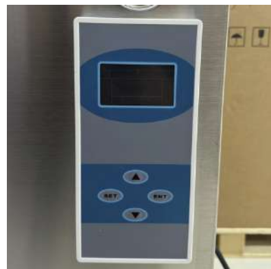
PANEL DE CONTROL LCD