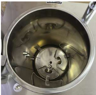
INTERIOR DE ACERO INOXIDABLE