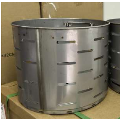
TAMBORES DE ESTERILIZACION